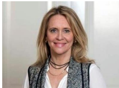
Mynd 3. Fiski- og landbúnaðarmálaráðharrin Þorgerður Katrín Gunnarsdóttir

Frágreiðingin um búskaparligu avleiðingarnar av verkfallinum sæst her (á íslenskum)