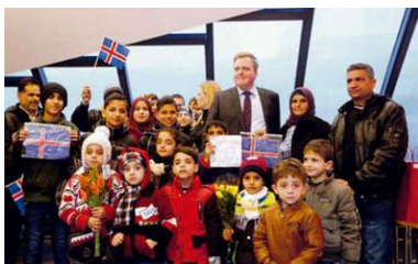
Íslenski forsætisráðharrin tekur ímóti flóttafólkunum í Keflavík.

Harumframt skal sendimaðurin til móttøku hjá kinesiska, russiska og danska sendiharranum.