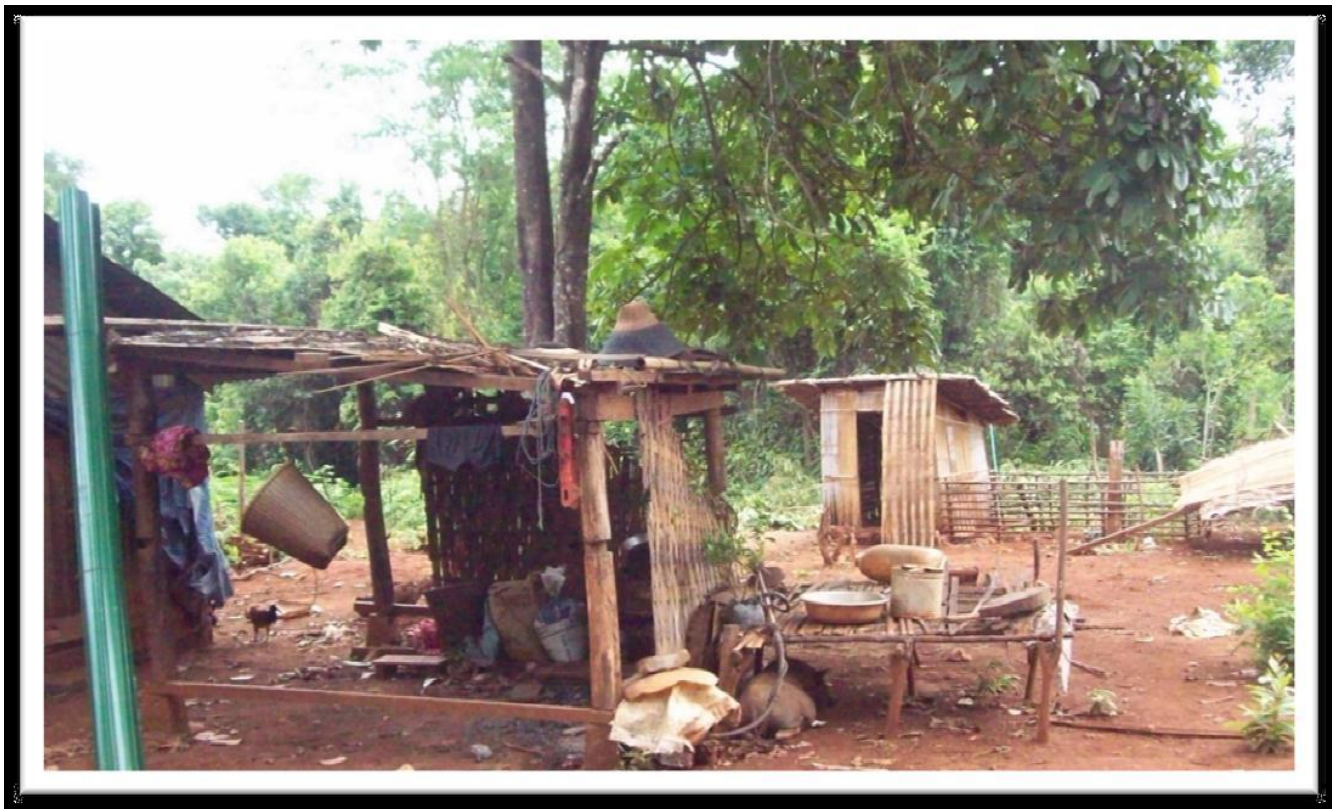
Á myndinni sæst ein ný-gjörd latrina. Latrinan er í munandi betri standi enn húsini.