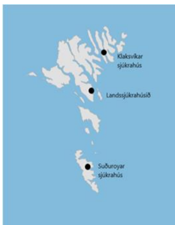
Figur 1: Oversigt over Færøerne og de tre sygehuse.

Færøerne består af 18 øer, hvoraf de 17 er beboede, og arealet udgør 1.396 km 2 . Fra nordligste til sydligste punkt er der 113 km, og fra vestligste til østligste punkt er der 75 km. Færøerne har ca. 53.000 indbyggere, og ca. 40% af befolkningen bor i Tórshavn, mens den øvrige del af befolkningen bor i større eller mindre byer og bygder. Der er 29 kommuner og 119 byer og bygder. I den største kommune, Tórshavn kommune, er der ca. 22.400 indbyggere, mens der i den mindste kommune er ca. 40 indbyggere. Færøerne er en delvist selvstyrende del af Rigsfællesskabet, ifølge Lov om Færøernes Hjemmestyre fra 1948, og udøver det parlamentariske selvstyre i et af verdens ældste parlamenter, Lagtinget.