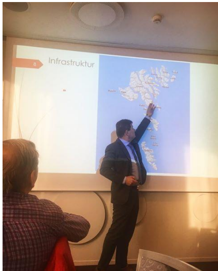
Mynd 12. Sendimaður Føroya greiðir frá um Føroyar fyri felagnum Heldra Fólk

Ein sera hugnaligur seinnapartur. Limirnir vóru sera væl nøgdir, og er stór lutttøka væntað til ferðina seinni í ár.