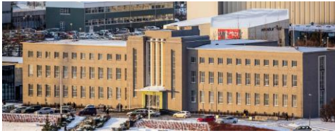
Mynd 9. Tey lesandi í Háskóla Íslands eru ónøgd við, at skúlagjaldið ætlandi skal hækkað við uml. 40%. Tey royna av øllum alvi at sleppa undan hesari hækkingi.