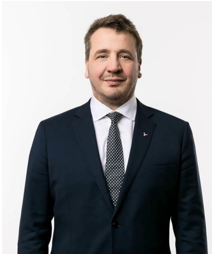
Mynd 7. Guðlaugur Þór Þórðarson ber nú ikki bert heitið uttanríkisráðharri, men hevur nú fingið heitið menningarráðharri afturat, so hann nú nevnist uttanríkis- og menningarráðharri.

Sí meira her (á íslenskum) og her (á enskum)