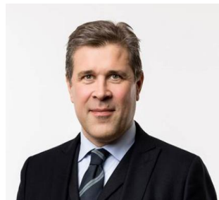
Mynd 5. Bjarni Benediktsson, fíggjarmálaráðharri.