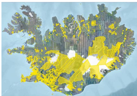
Mynd 2. Aetlanin er at leggja lógarbroytingar fyri Altingið, so treytirnar fyri keypi av størri ognarlutum í Íslandi gerast strangari fyri útlendingar, serliga teir, sum búgva uttanfyri EBS.

Eitt lógaruppskot við broyting í ymsum lógum er komið í Altingið, sum skal loyva myndugleikunum at avmarka sølu av jarðarlutum. Við ætlaða lógaruppskotinum skulu keyp av størri jarðarlutum góðkennast av avvarðandi ráðharra.