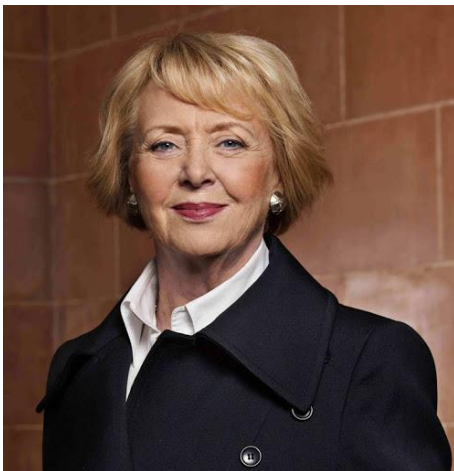
Mynd 8. Vigdís Finnbogadóttir, fyrrv. forseti, fyllir 90 ár 15. apríl. Í hesum sambandi heiðrar almenna Ísland Vigdís. Seinni í ár eru 40 ár síðan Vigdís varð vald sum forseti Íslands, og var hon forseti í 16 ár.