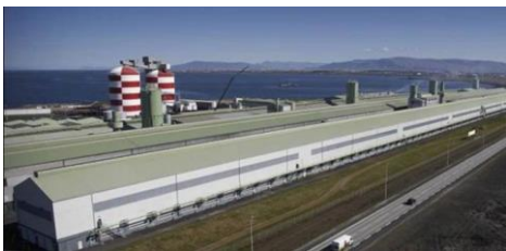
Mynd 1. Rio Tinto, málmbæðingarvirkið í Hafnarfirdi sunnanfyri Reykjavík.

Nógv spennandi tiltøk bíða eftir, at støðan normaliserast.