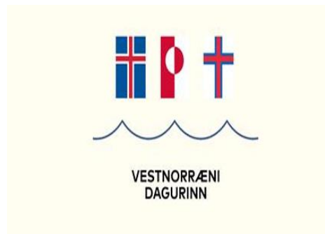
Mynd 9. Útnorðurdagurin var í ár hildin fyri fyrstu ferð í Reykjavík. Byrjað varð í Veröld - húsi Vigdísar og síðan varð farið í Norrøna húsið.

Sendimaðurin varð biðin um at halda fyrilestur um Føroyar og føroysk viðurskipti fyri Rotary klubbanum í Austurbær. Tað vísti seg, at ein av limunum í hesum Rotary klubbanum eisini var partur av felagnum fyri fyrrverandi sendifólkum, sum sendimaðurin fyrr í mánaðinum hevði hildið fyrilestur fyri. Fitt av fólkum var møtt upp og nógvir spurningar og nógv kjak var. Slíkir fundir geva einastandandi góð høvi til at kunna og breiða út kunnleika um Føroyar, samstundis sum sendimaðurin og Sendistovan fær styrkt og víðkað um sítt virðismikla netverk.