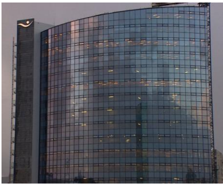
Mynd 5. Stendur tað til fíggingarmálaráðharran, Bjarna Benediktsson, so verður Íslandsbanki skjótt lýstur til sølu.

Heimasíðan, sum m.a. er gjørd til endamálið, er eitt samstarv millum Promote Iceland, Ídnaðarsamtakið og ráðharraráðið fyri ídnað og nýmenning. Heimasíðan er á enskum og fevnir um alla ta kunning, sum er neyðug, fyri at hesi fólk kunnu gera av um Ísland er nakað fyri tey.