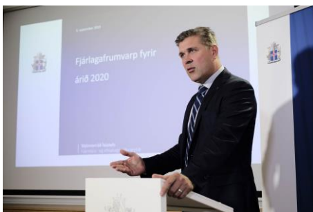
Mynd 2. Bjarni Benediktsson leggur fram fíggjarlógina fyri 2020.