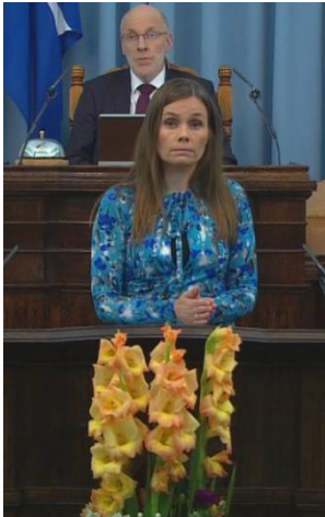
Mynd 1. Katrín Jakobsdóttir, forsætisráð- harri heldur sína hövuðsröðu í Altinginum

samráðingarnar, har týðningarmiklasti leikluturinn hjá myndugleikunum var at økja um sosialt stöðufesti. Skattabyrðan skal lækkast hjá teimum við lægstu inntøkunum. Barnsburðarfarloyvið skal leingjast og barnaískoytið hækkast. Arbeitt verður við at bøta um móguleikan at fáa atgongd til rímiligar íbúðir.