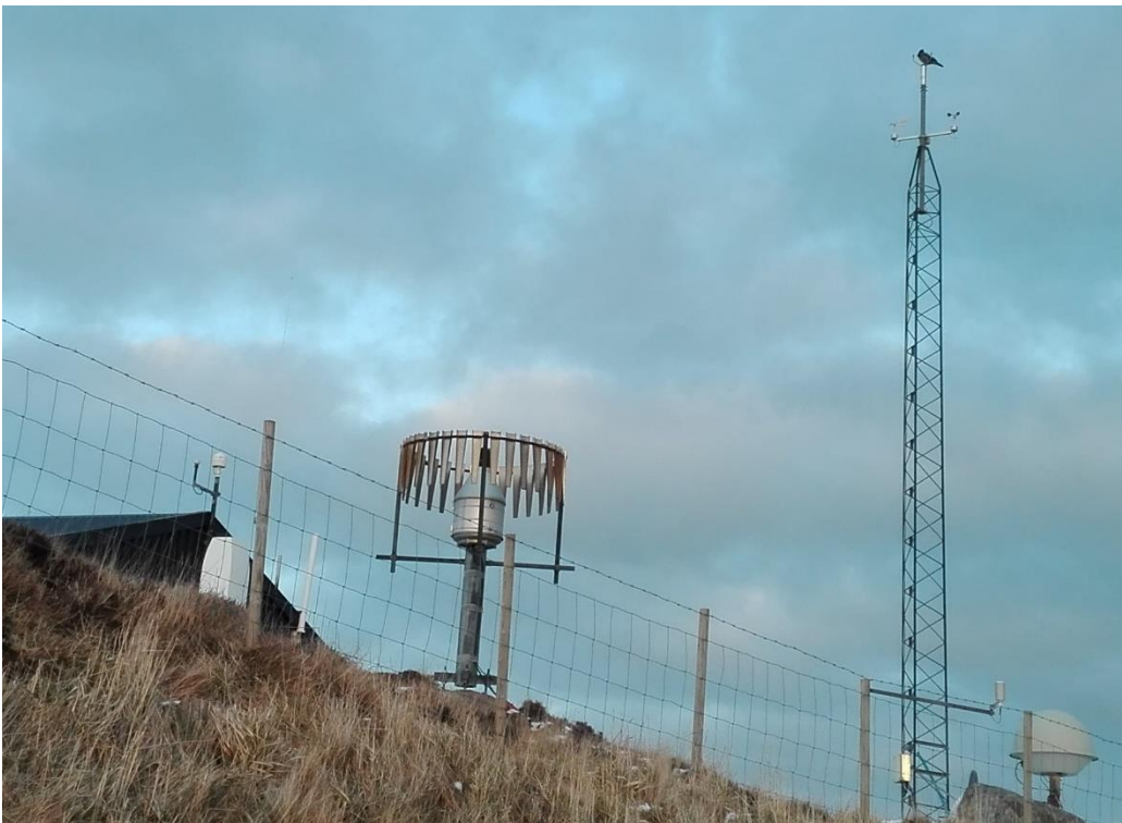
Veðurstøðin á Boðanesi, Hoyvíksvegur 69, Tórshavn.

Tað er stórir tørvur á og stuðul til arbeiði at fáa ein dagfórðan føroyskan veðurstovn. Tað verður mett, at við eini meirupphædd uppá góðar 3 mió kr., frá einari árliga upphædd á umleið 5 mineyügtó kr. til umleið 8 mió kr., er møguleiki at fáa byrjan á eina dagfórða, útbygda og nøktandi føroyska veðurtænastu við betri og meira álítandi veðurforsagnum fyri allar Føroyar og føroysk áhugaøki, betri miðling og luttøku í kanningum og granskingum av veðri, veðurlagi og veðurlagsbroytingum til gagns fyri sjóvinnu, vinnu á landi, flogferðslu, tilbúgving og tað føroyska samfelagið sum heild.