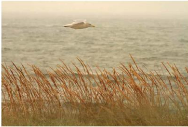
Mynd 1. Nýggj frágreiðing, sum greinar móguligar avleiðingar av Brexit fyri Ísland.

Íslenska stjórnin hevur júst latið úr hondum eina frágreiðing um kanning av móguligum avleiðingum fyri Ísland, tá Bretland fer úr EES. Bretski marknaðurin er ein sera týðningarmikil marknaður fyri Ísland, og tí hevur íslenska stjórnin arbeitt hart fyri at tryggja, at áhugamálini hjá Íslandi eru varð og at hugsandi móguleikar ikki fara afturvið borðinum. Tí hava fleiri ráðharrar og embætisfólk havt fundir á høgum stigi við bretsku starvsfelagar sínar, samstundis sum arbeitt verður tætt við hini EFTA londini og við ES og tess limalond. Ísland er bæði framtakssamt og nýhugsandi, tá tað kemur til framtíðarmóguleikar og er bjartskygt um at eitt uppbyggjandi úrslit fer at spyrjast burturúr.