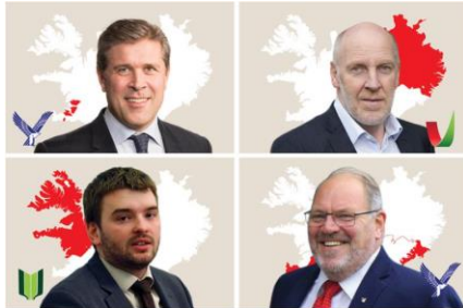
Mynd 3. Hesi fjóra valevnini vóru oftast útstrikað. Bjarni Benediktsson (ovast t.v.), Steingrímur J. Sigfússon, (ovast t.h.), Ásmundur Einar Daðason (niðast t.v.) og Ásmundur Friðriksson (niðast t.h.).

Ein veljari kann bert strika eitt valevni út hjá tí flokki, hann velur.