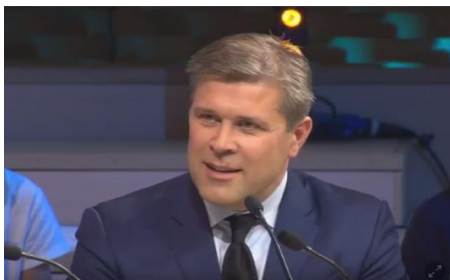
Mynd 7. Bjarni Benediktsson, forsætisráðharri, tosar á Global Positive Forum.