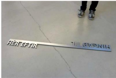
Mynd 1. Álitid frá arbeidsbólkinum um framtíðar íslensk uttanríkis viðurskipti.