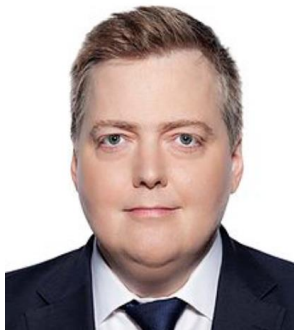
Mynd 4. Sigmundur Davíð Gunnlaugsson, fyrrv. forsætisráðharri er farin úr Framsóknarflokkinum og hevur stovnað nýggjan flokk, Miðflokkurin.

Sum tað framgongur av myndini omanfyri, so fær Björt framtíð (A) bert 2,7% av atkvøðunum (triði stabbi) og gevur tað ongan altingslim, tí altingsgáttin í Íslandi er 5%. Í Føroyum er tinggáttin 3%. Björt framtíð (A) sat í samgonguni og var flokkurin, ið sleit samgongusamstarvið. Viðreisn (C), sum eisini var ein av samgonguflokkunum, fær einans 3,1% ella ongan altingslim, sambært hesari kanning. Undanfarnu veljarakanningarnar hava víst somu gongd, tó við nakað hægri undirtøku til hesar báðar flokkarnar. Um so verður, so kemur hvørgin av hesum báðum samgonguflokkunum í Altingið eftir valið 28. oktober. Men mangt kann henda fram til valdagin.