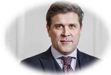
Mynd 1. Bjarni Benediktsson, forsætisráðharri. Bjarni var fíggjarmálaráðharri í undanfarnu stjórn.

Hinvegin er Bjarni Benediktsson, forsætisráðharri, ikki bilsin av hesum sjónarmiði og vísir á samgonguskjalið, har tað m.a. stendur, at hildið verður fram við krónuni sum gjaldoyra Íslands. Vit hava gjørt av at hyggja nærri at peningapolitikkinum við framhaldi av íslensku krónuni, og at hyggja nærri at, hvussu vit kunnu vinna á sveiggunum.