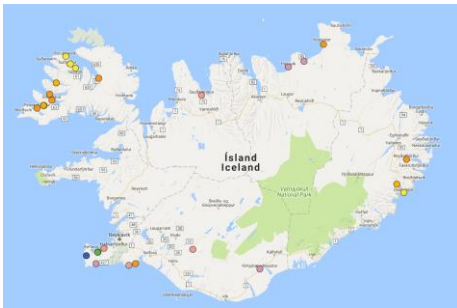
Mynd 6. Her síggjast aliokini í Íslandi.

● Laxeldi ● Silungselði ● Bleikja ● Þorskelði ● Hrogn, seiði, kynbættur, eidi ● Senegal flúra