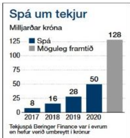
Mynd 4. Meting hjá Beringer Finance um inntøkur í íslensku alivinnuni komandi árin.

Um íslenska alivirksemin kann økjast enn meira, fer hon at geva uml. 1.1 mia. evrur, ella 8.1 mia. DKK í eykainntøkum til íslensku tjóðina. Sambært nýggju kanningini hjá Beringer Finance, verður hugt at íslenskar laksaaling og teimum møguleikum, sum eru í vinnuni. Um forsøgnin hjá íleggingargrunninum verður veruleiki, kann hugast, at landsframleiðslan hækkar við 5% og verður tá 5-6% av heimsmarknaðinum. Hetta kann samanberast við, at í 2015 var fiskaframleiðsla í Íslandi 8% av landsframleiðsluni. Um so verður, høvdu 6.000 íslendingar fingið starv í alivinnuni. Til samanberingar kann nevast, at um 9.000 starvast innan fiskivinnuna.