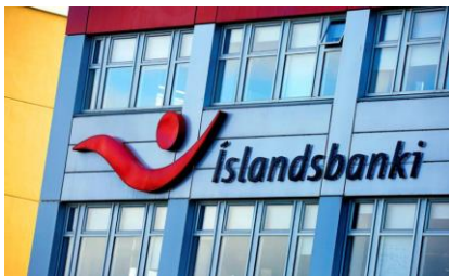
Mynd 2. Landið ynskir at selja Íslandsbanka.